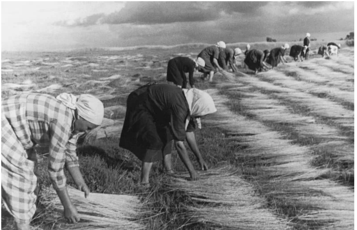
На фото – труд вязальщиц снопов.